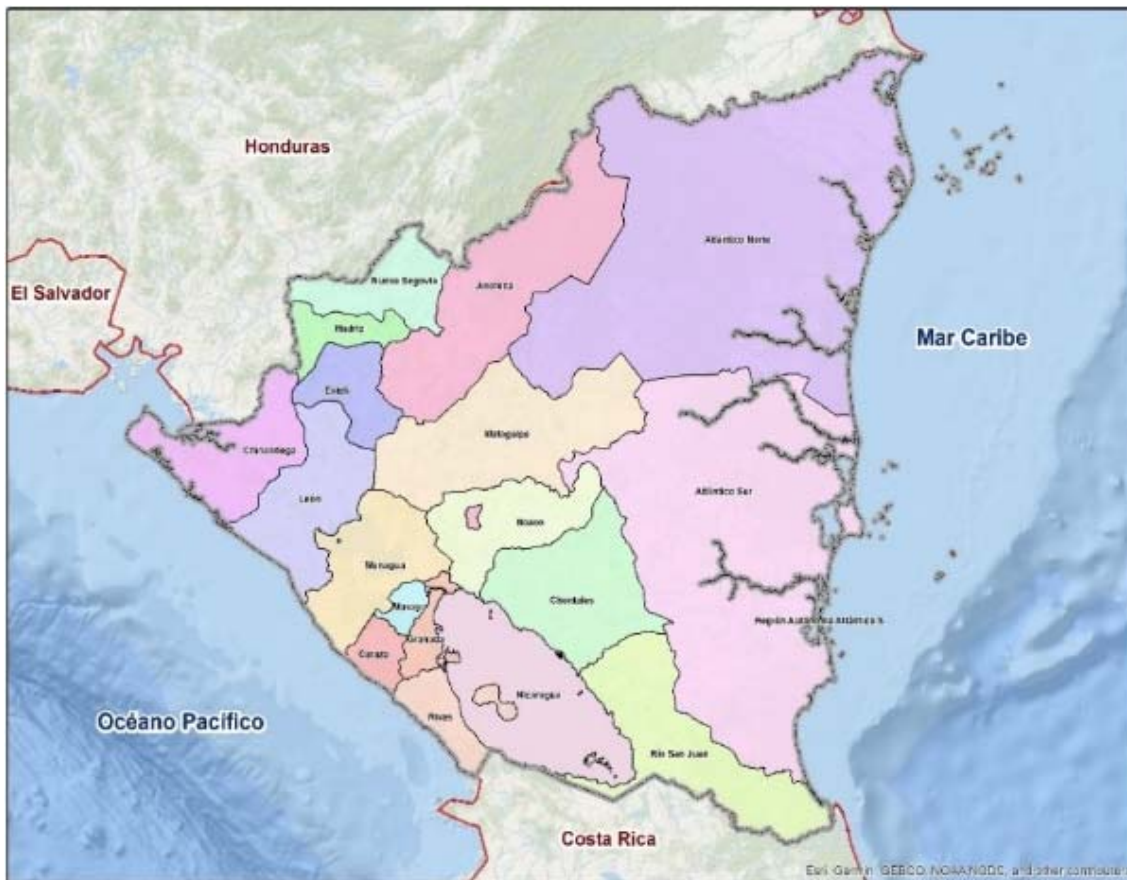
Mapa 1 DIVISIÓN POLÍTICO-ADMINISTRATIVA DE LA REPÚBLICA DE NICARAGUA