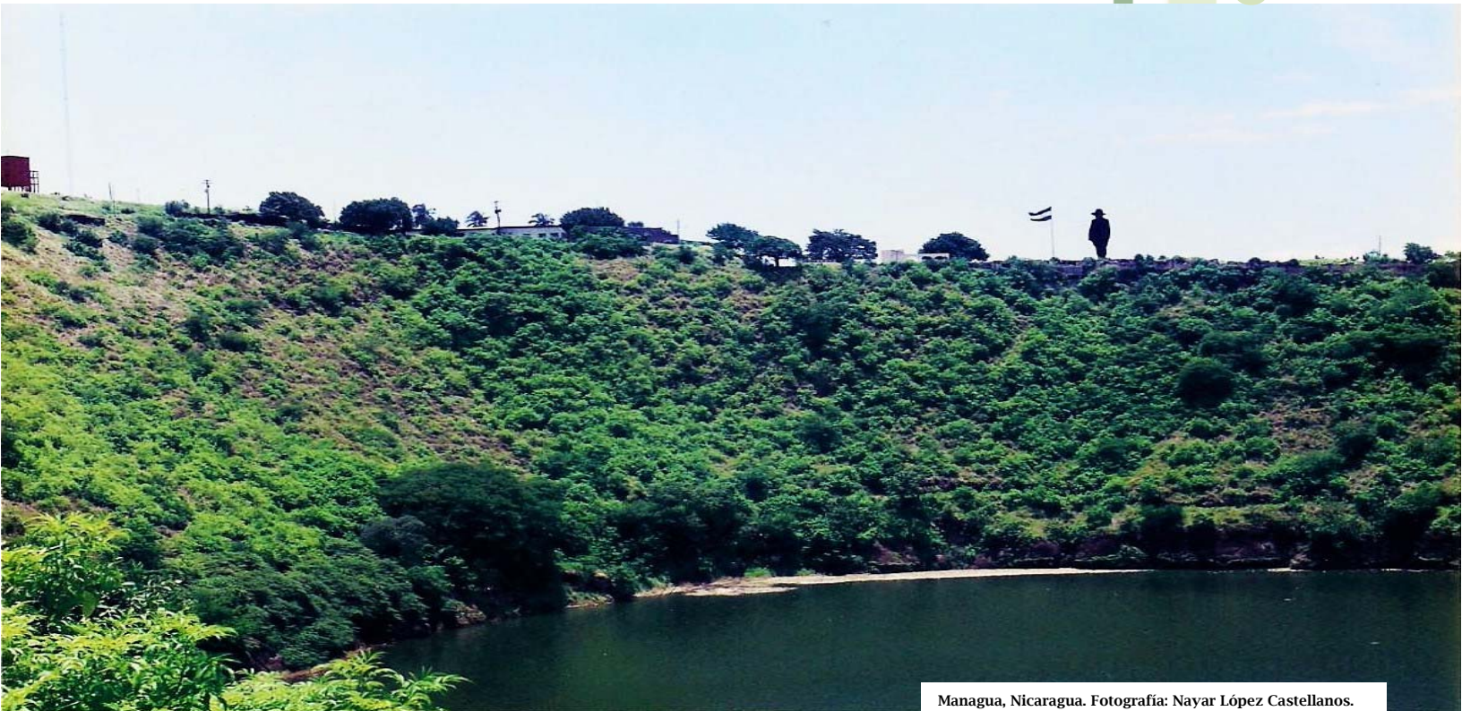
Managua, Nicaragua.