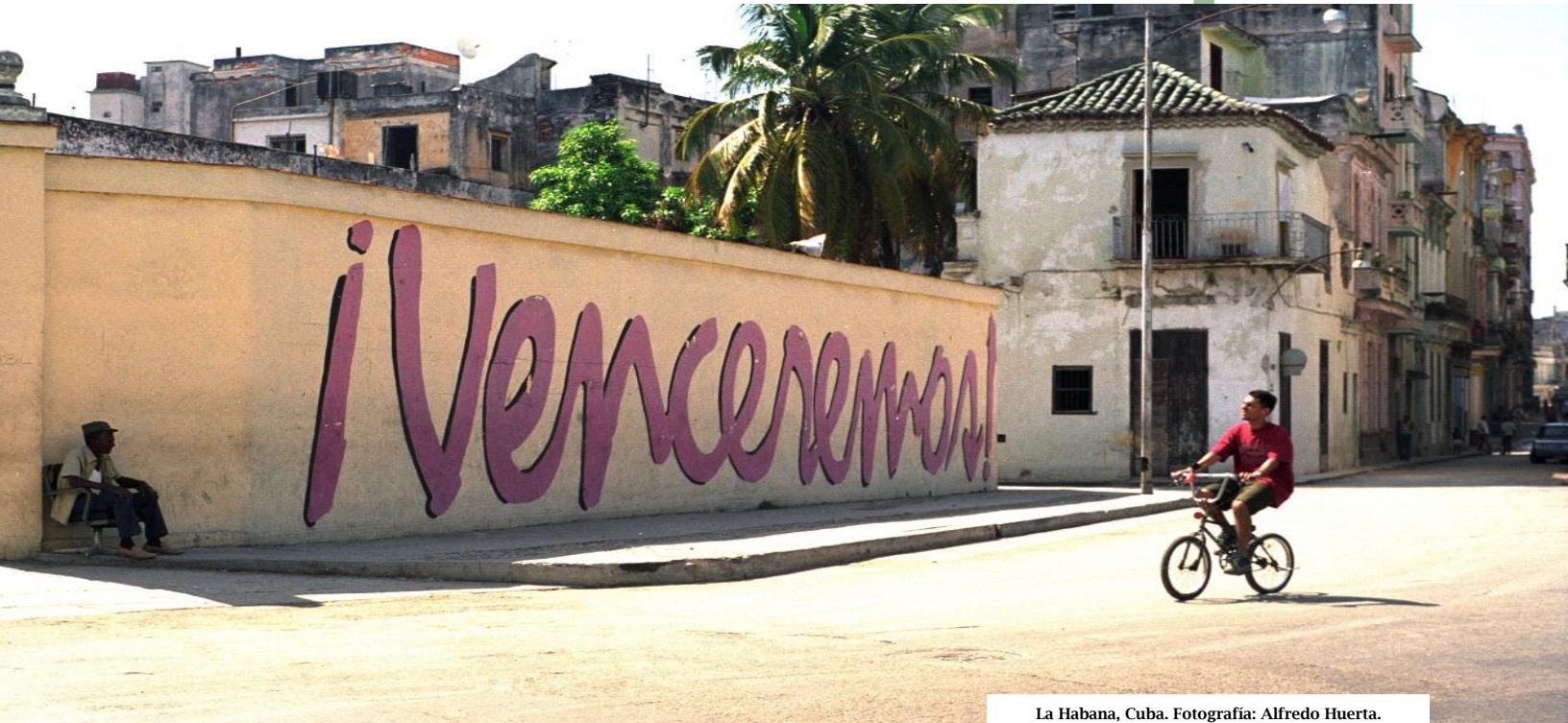
La Habana, Cuba.