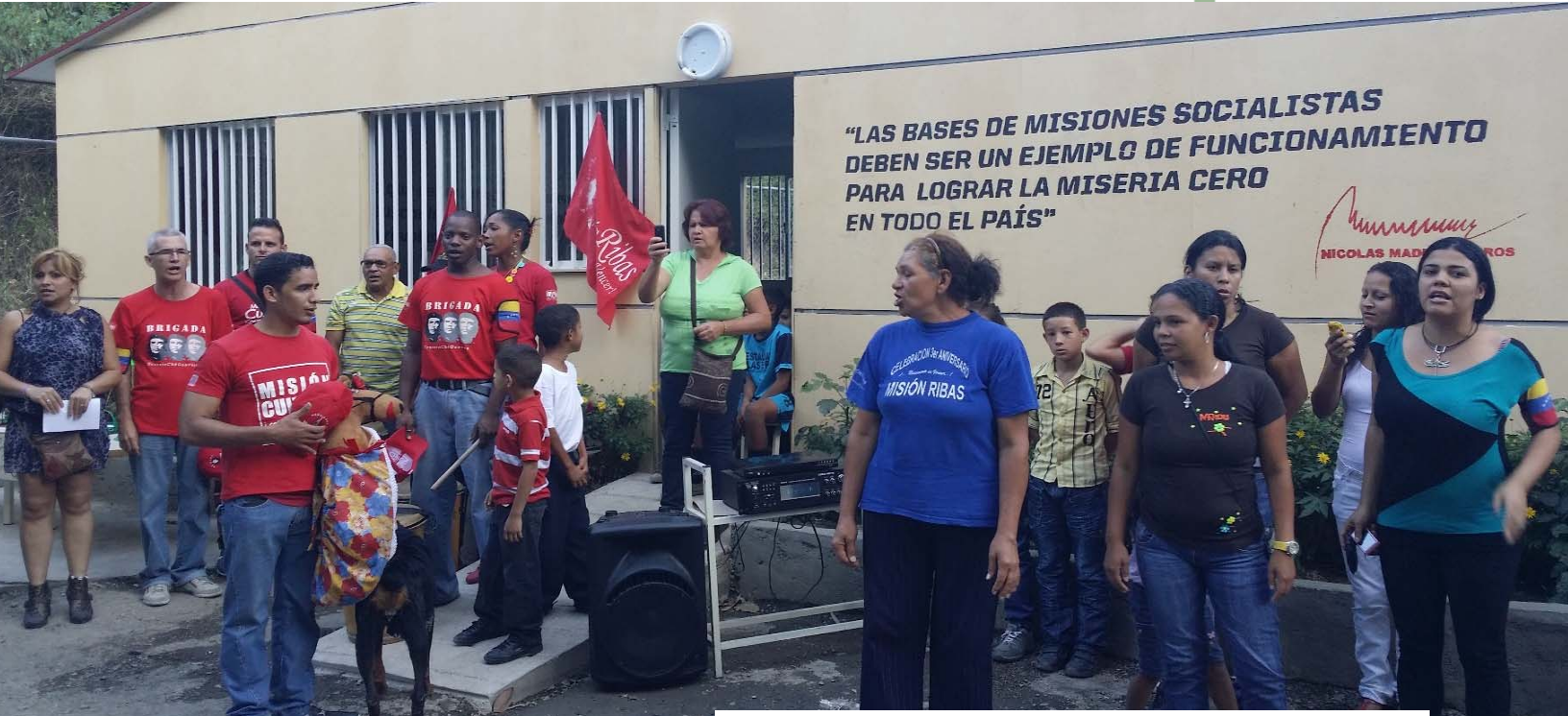
Sede de Misiones Bolivarianas, Caracas, Venezuela.