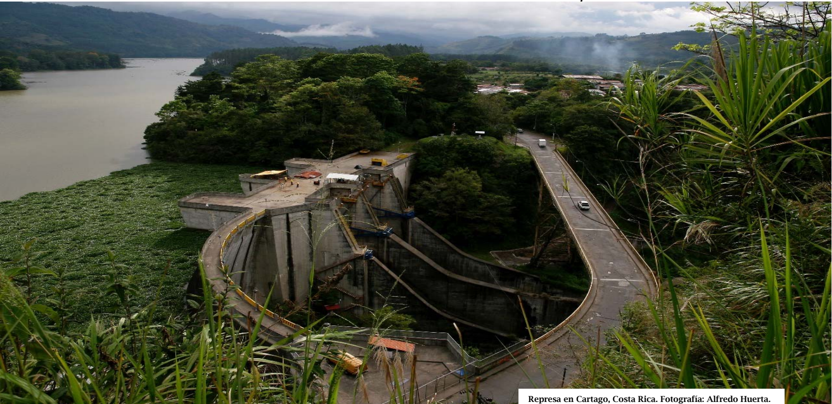
Represa en Cartago, Costa Rica.