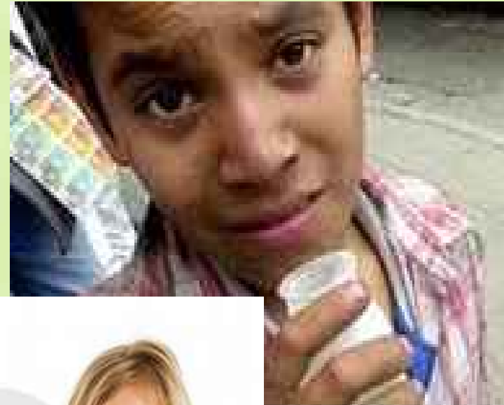
Ruiz Caballero, AP