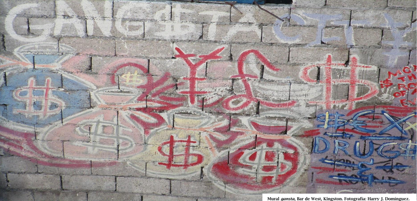
Mural gansta , Bar de West, Kingston.

Black a kill black, lord But a go bounce right back, yeah Let me tell you