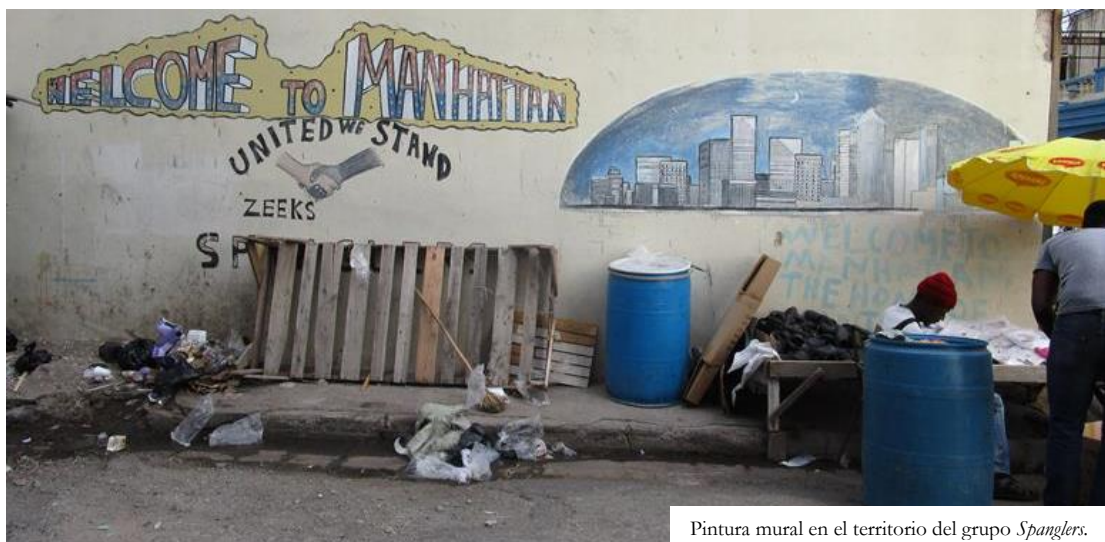
Pintura mural en el territorio del grupo Spanglers .

En la contraparte, el entonces jefe del Departamento de Policía del oeste de Kingston afirmaba que desde su experiencia no existía crimen organizado en esta área o no era parte de lo que los medios denominan violencia pandillera en Jamaica, puesto que el problema de las pandillas –desde su punto de vista– se da en ocasiones sólo porque un hombre te ve mal o por problemas superfluos. En sí, “muchas gente en Jamaica asesina a otra sin razón, sólo porque quieren mostrarse malos, después de un conflicto, un baile o sólo porque se te quedan viendo por largo tiempo” (S. McGregor, comunicación personal, 5 de enero de 2015). Sin embargo, como se observa, ésta es una forma de minimizar el problema del crimen organizado y de generalizar la idea de crimen en todas las pandillas.