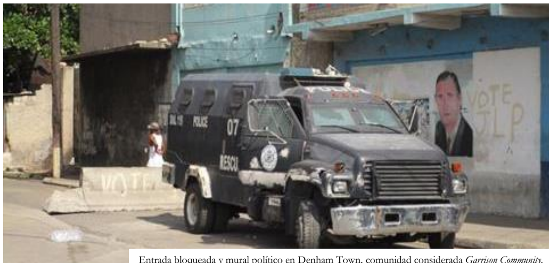
Entrada bloqueada y mural político en Denham Town, comunidad considerada Garrison Community .