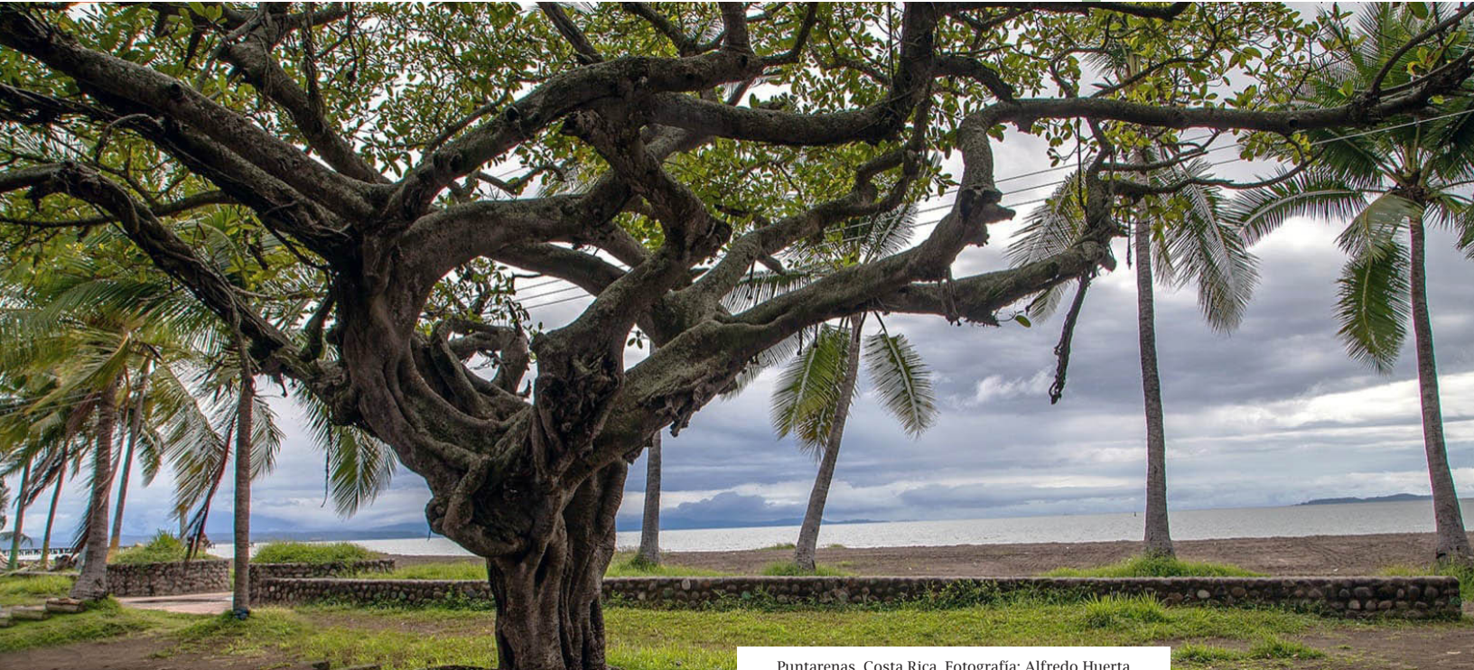
Puntarenas, Costa Rica.