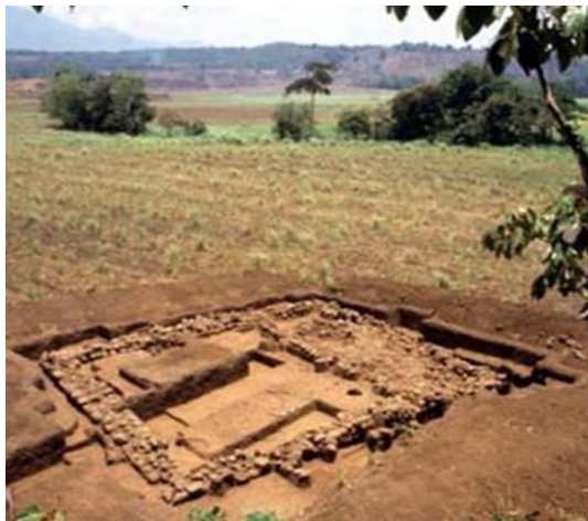
Imagen 4 Estructura prehispánica ubicada en las cercanías del centro ceremonial del sitio Tacushcalco

Fotografía Sampeck (2011). Revista La Universidad , núm.14.