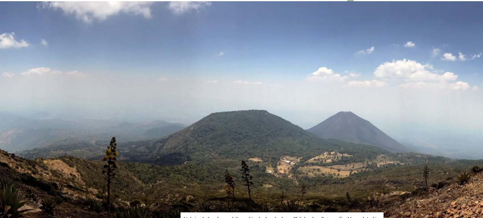
Volcán de Izcalco y el Cerro Verde, Los Izalcos, El Salvador.