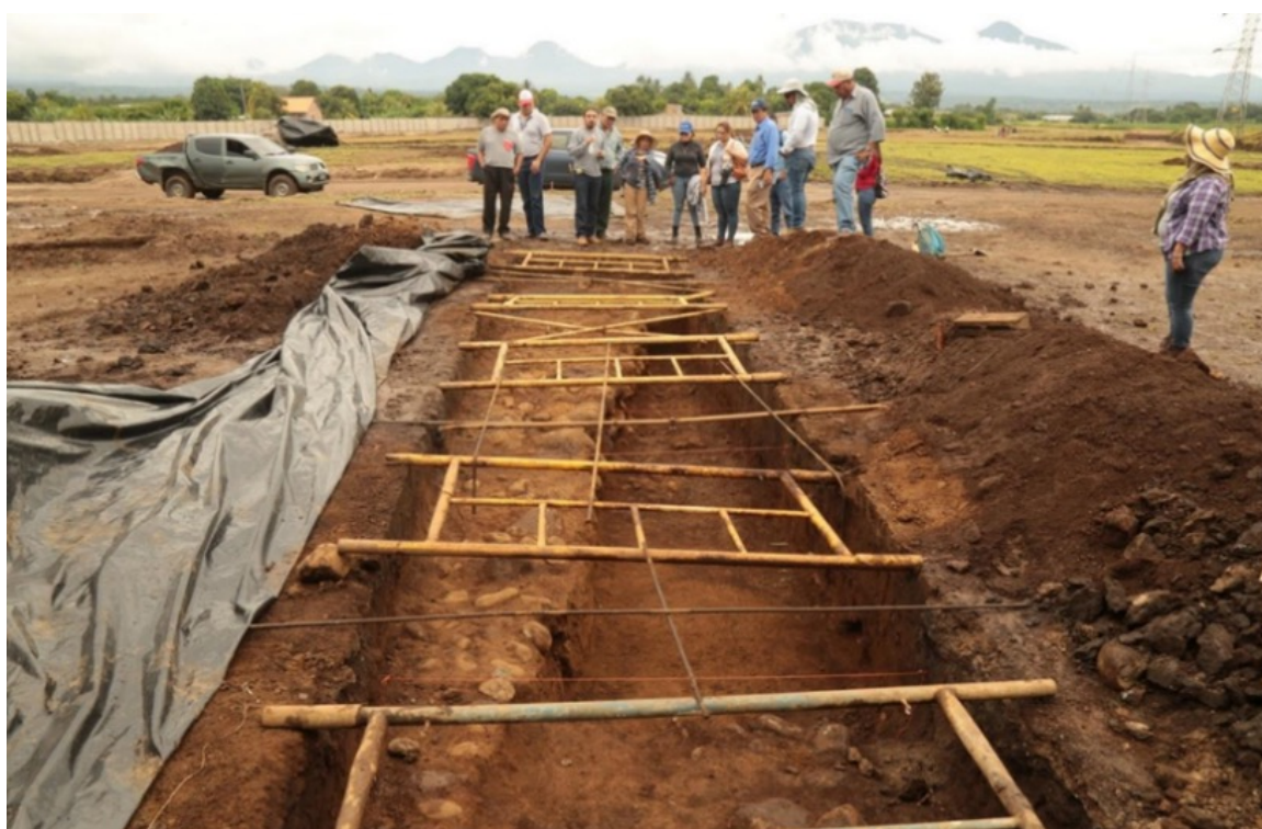
Abajo: estructura prehispánica destruida por proyecto urbanístico Acrópolis Sonsonate de inmobiliaria Fenix-Salazar Romero en 2018. Arriba: producción de estructura prehispánica destruida en 2020 por tractor de empresa COAGRI dedicada a la producción de caña de azúcar.