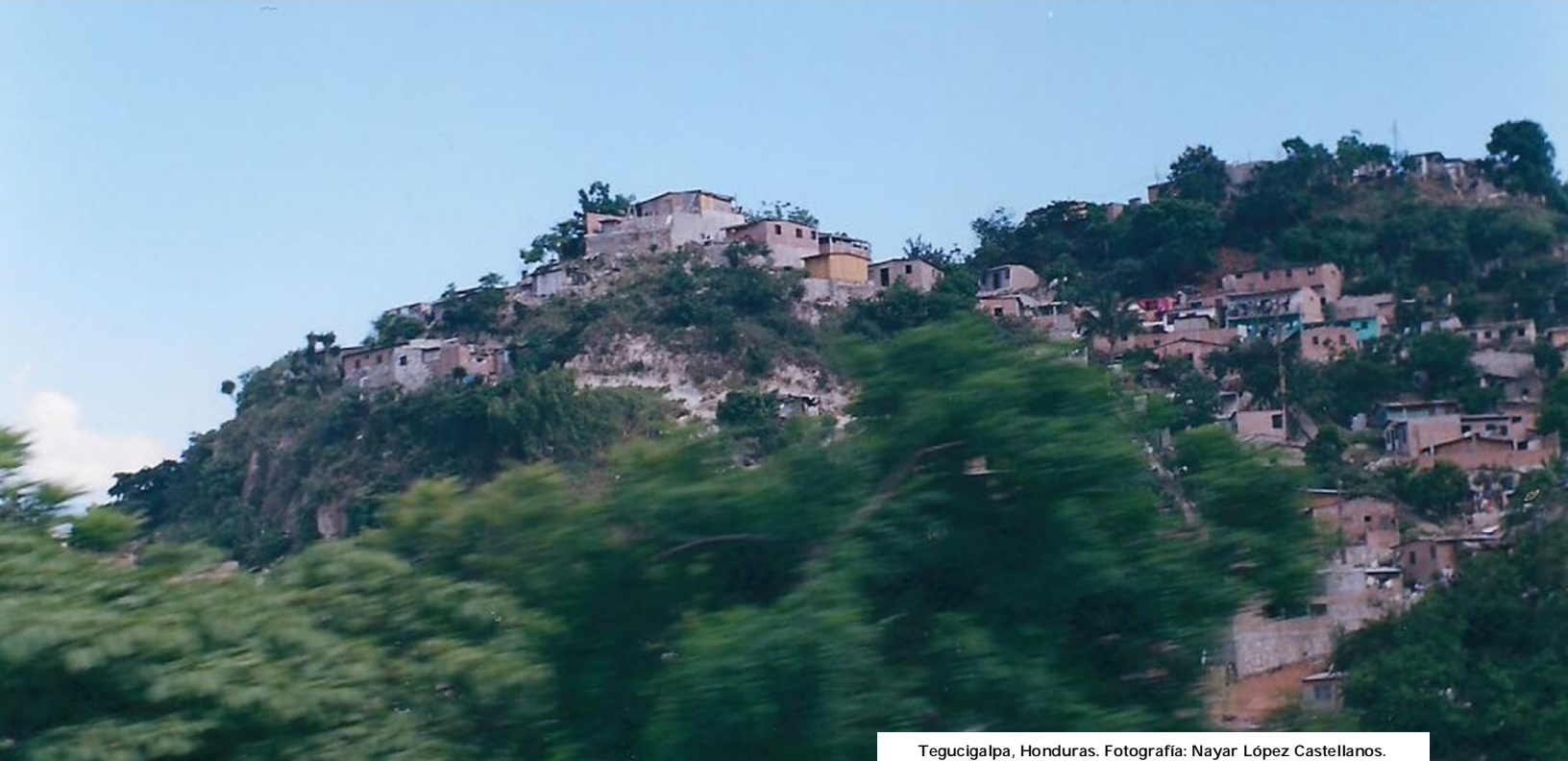
Tegucigalpa, Honduras.