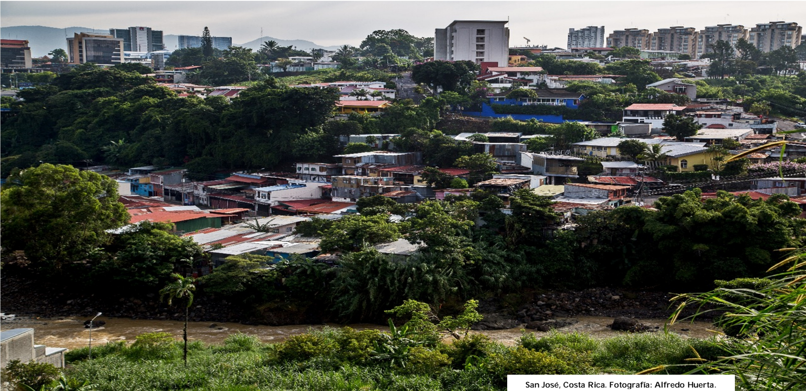
San José, Costa Rica.